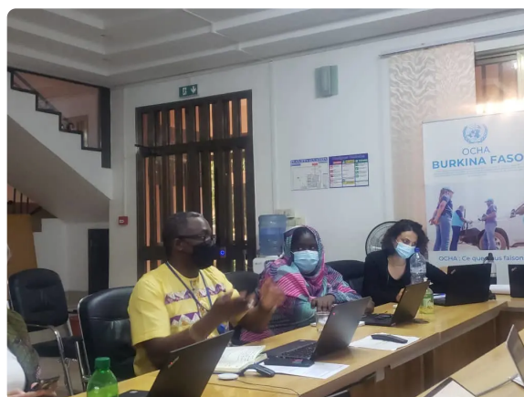
Des experts du bureau Régional sont présents au Burkina Faso pour la mise en place de l'enveloppe pays du Fonds Humanitaire Régional.

Afin d'activer l'enveloppe Burkina Faso, une équipe venue de bureau régional est présente dans le pays. Durant la mission, l'équipe va travailler à asseoir le conseil consultatif du fonds et d'informer la communauté humanitaire sur l'existence du fonds et des conditions d'allocation. Ce fonds s'adresse essentiellement aux organisations non gouvernementales de la communauté humanitaire mais également aux agences des nations unies travaillant dans l'humanitaire.