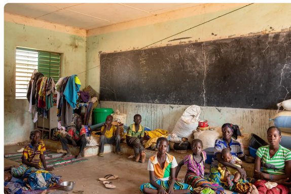
Plus de 30 000 personnes ont été contraintes de fuir leur maison pour trouver refuge ailleurs.

En effet à la date du 30 Septembre 2021, la province du Sanmentenga enregistrait 466 314 personnes déplacées internes et venait en tête des provinces d'accueil. Ces déplacements impliquent une implosion de besoins chez les personnes en mouvement à savoir des besoins en abris, en alimentation, en articles ménagers non essentiels et donc aussi une forte mobilisation de la communauté humanitaire pour répondre à ces besoins.